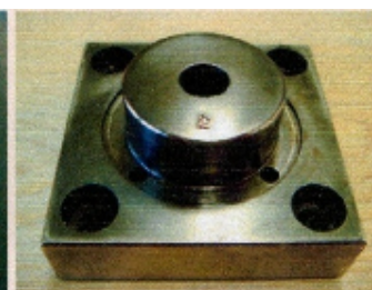
アルミニウム製射出成型金型